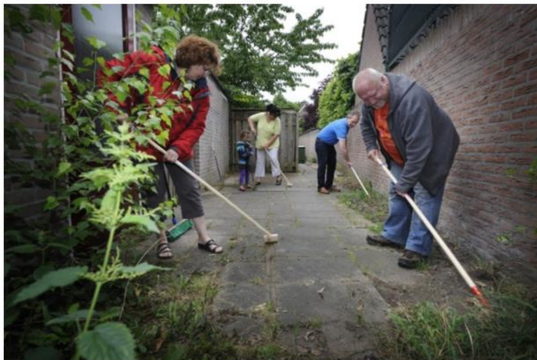
'Dienstverlening moet voor iedereen toegankelijk blijven, niet alleen voor participerende burgers.'